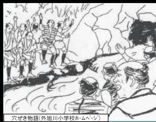
穴堰き物語(外旭川小学校ホームページ)