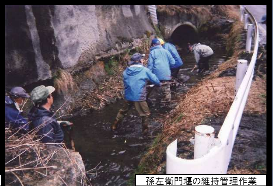
孫左衛門堰の維持管理作業