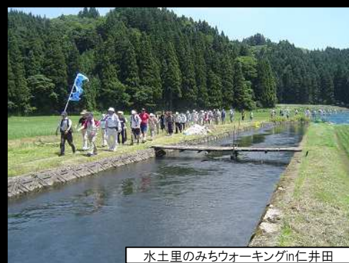
水土里のみちウォーキングin仁井田

そして、農地や水を地域共有の財産として保全継承していくことで、地域の絆の強化や地域活力の向上につなげていくことができないか考える。