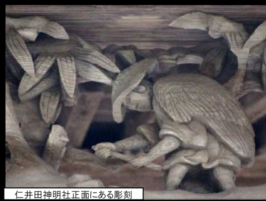
仁井田神社正面にある彫刻