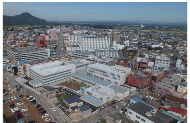
大曲通町地区(全景)