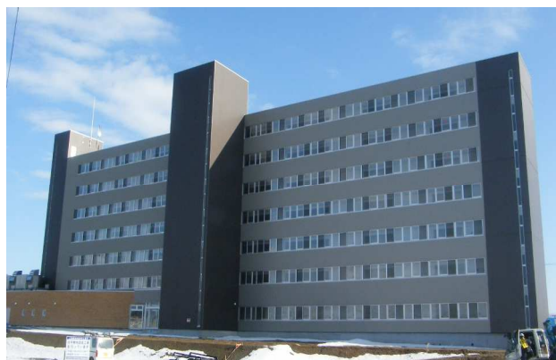
大曲駅前第二地区 都市再生住宅