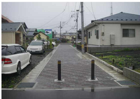
秋田駅東第三地区 公共施設(道路)