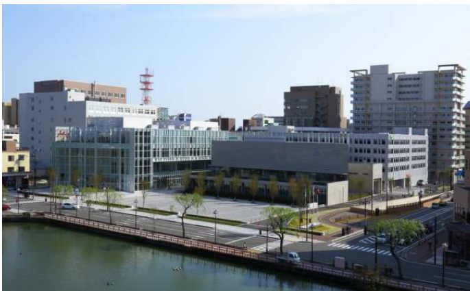
中通一丁目地区(全景)