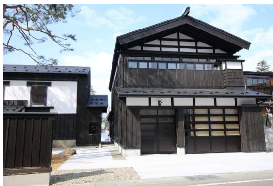
生活環境施設整備