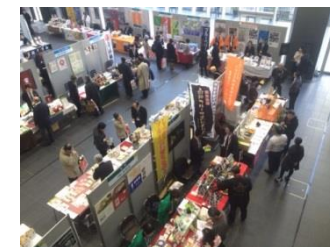
東京・秋葉原で開催した「秋田のおいしい食材商談会」