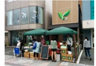
テント市「△三えんにち」