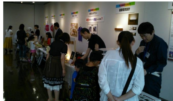
中小企業応援フェスタ(エリアなかいち)の様子