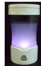
産業技術センターの技術支援により開発した携帯型水素水生成器 ((株)八森電子デバイス(八峰町))