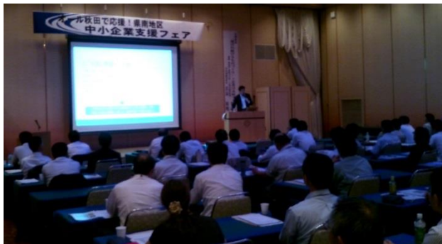
県南地区中小企業支援フェア(横手市)の様子