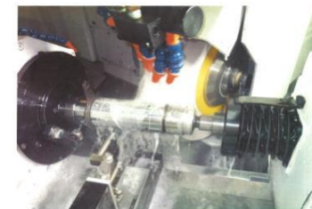
航空機ランディングギア部品の研磨工程