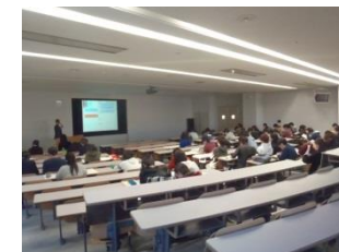
県内大学での起業に関する特別講演

【初期投資等の支援（起業支援補助金）：採択13件（うちAターン・移住枠5件） （H26年度11件）】