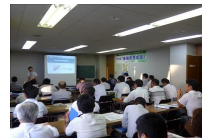
後継者育成塾の様子