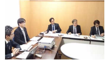
専門家との打ち合わせの様子