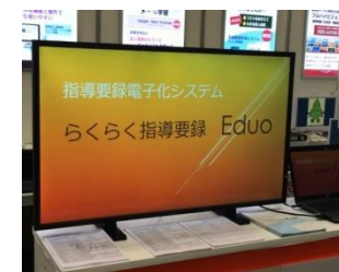
開発した教員用「指導要録作成システム」 ((株)フォラックス教育(湯沢市))

○新製品や新サービスの開発・生産等の意欲的な取組を行う企業に対して、機械器具の導入や人材育成経費等をハード・ソフト両面から支援。