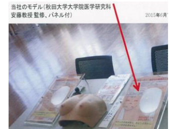
がん組織の触診用教材