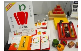
UVプリンターで制作したパッケージ