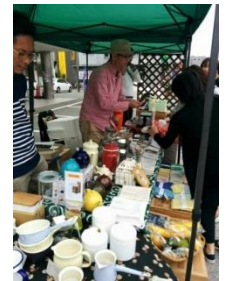
各個店がオリジナル商品をアピール