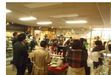
セミナー講師によるお店づくり指導

【地域資源等を活用した地域産業の振興】 （支援事業名：提案型地域産業パワーアップ事業）