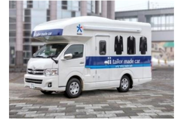
テーラーメイドカー