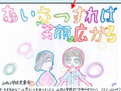
山内小学校児童会 「おや、大丈夫かな?」と思うことありましたら、山内小学校までお知らせ下さい。(53-2207)