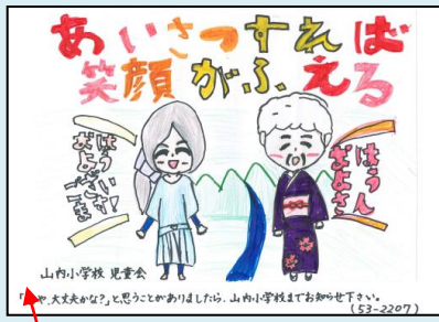
山内小学校児童で作成したポスターです!

生の児童が、地域の住民に積極的な防犯活動への協力をもらうために、地域住民にあいさつを呼びかけるためのポスターを作成し、横手市の協力により、山内地域全世帯に1150部を配布しました。