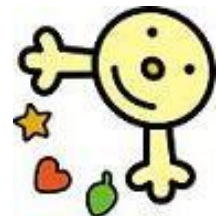
秋田県環境美化マスコット「クリンちゃん」

登録を受けた団体等については、その活動内容を県ホームページ「美の国あきたネット」等で紹介するなど、登録団体の活動を支援しています。