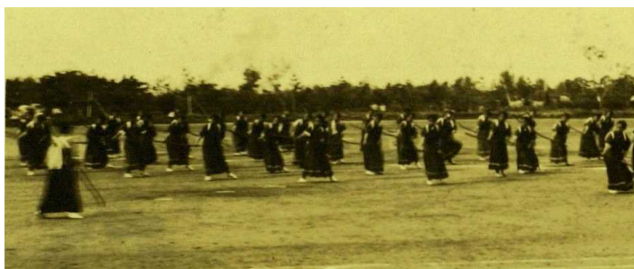
昭和5年女子技芸学校薙刀体操

現在、秋田県内の県立女子高校は共学化、もしくは統合の対象となっており、県内において近い将来「女子高」として存続するのは私立高校のみとなります。