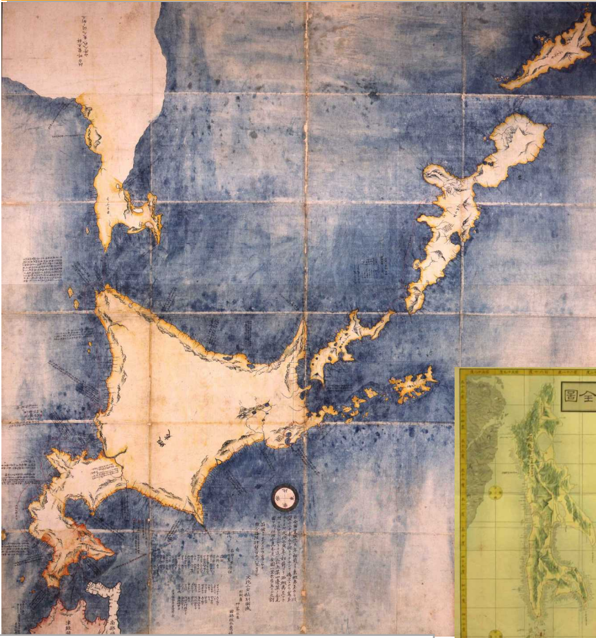
企画展ポスターで使用した蝦夷地の絵図。現在の地図に近い北海道の形を御堪能ください。

秋田県公文書館では、来る十月二十四日(火)～十一月十二日(日)の日程で、企画展「秋田藩の海防警備」後期展示を行います。