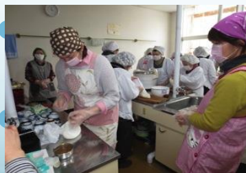
秘伝を伝授 だまこ鍋づくり