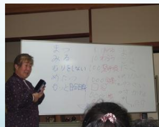
昔語り 健康生活のお話