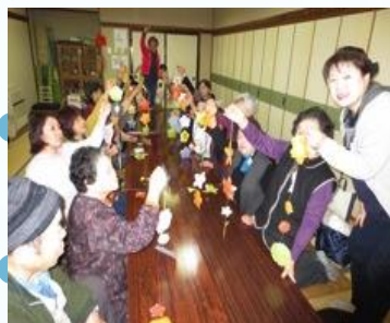
和紙で折り紙 手作りタイム