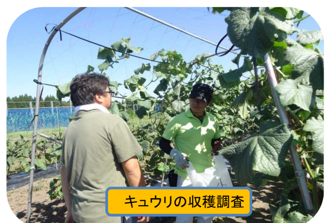
キュウリの収穫調査