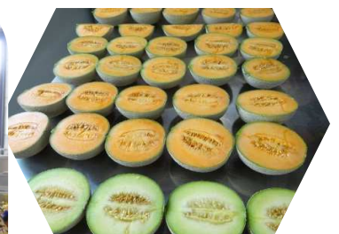
メロンの糖度測定