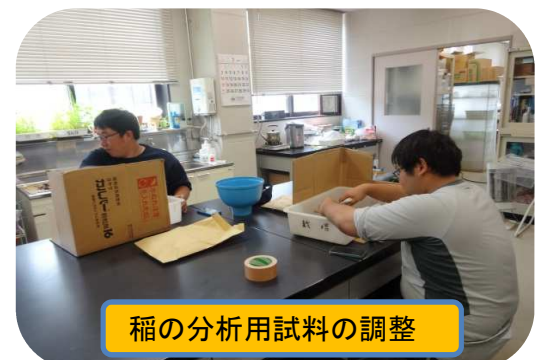
稲の分析用試料の調整