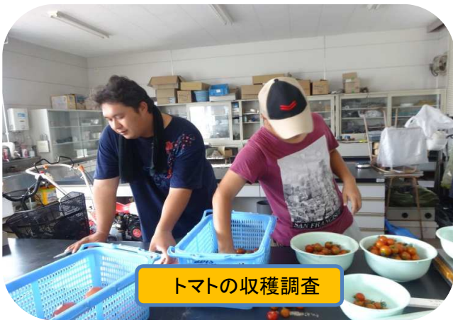
トマトの収穫調査