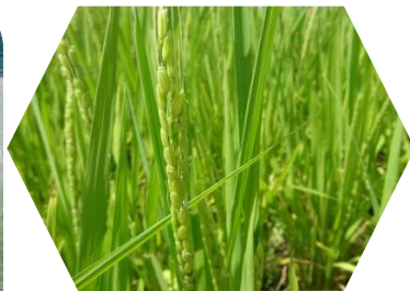
水田ほ場での調査の様子