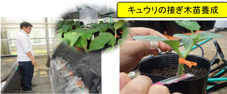
キュウリの接ぎ木苗養成