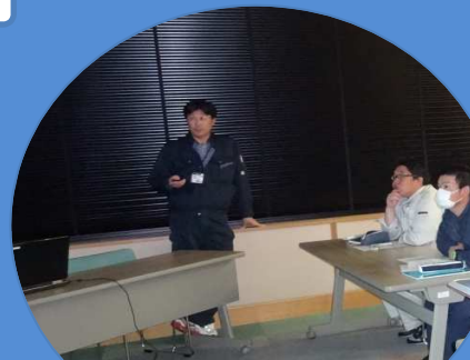
農業試験場専門座学研修