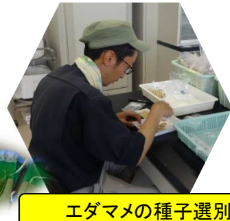
エダマメの種子選別