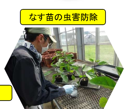
なす苗の虫害防除