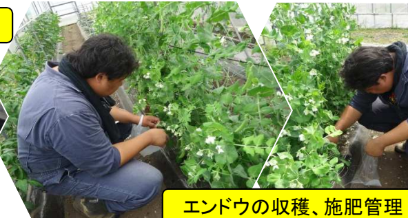
エンドウの収穫、施肥管理