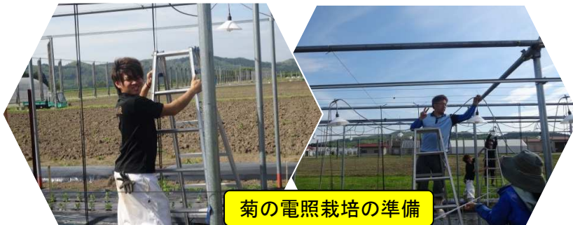
菊の電照栽培の準備