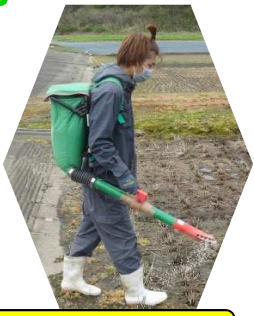
水田ほ場での施肥