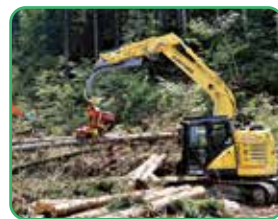
▲木の伐採・玉切を行う高性能林業機械ハーベスタ

皆さんから「女性は手先が器用だから機械操作に向いている」とよく言われるので、資格を取って高性能林業機械のオペレーションもやってみたいです。