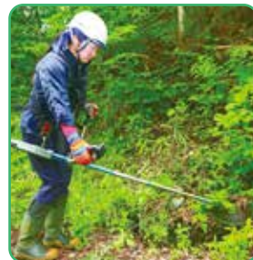
▲木の生長を見守る気持ちで下刈作業

現在は造林班に所属し、下刈り、植栽、除伐など、木を育てる仕事に携わっています。野球を通じて、礼儀やコミュニケーションの取り方などを学んできたことが、仕事でも非常に役立っています。