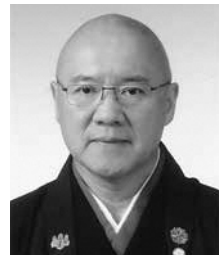
「あきたの文芸」 令和4年