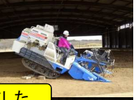
色々な機械の操作を体験しました