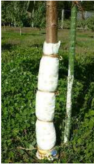
図1 モモの主幹を高分子吸水シートで被覆した様子