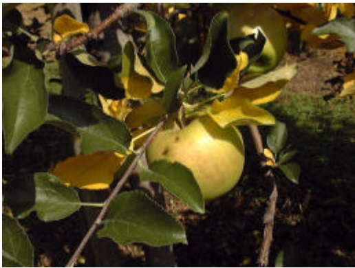
効果が現れ黄変した果そう葉