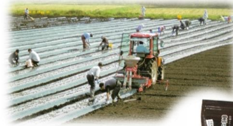
にんにくの定植作業