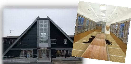
阿仁合駅とマギ列車(内装イメージ)