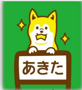
今年の田んぼアート