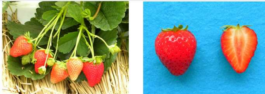
図2 「Portola」の着果状況と果実 (2011年)