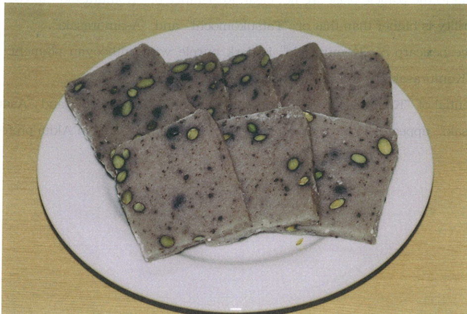
写真4 小紫で作った豆餅