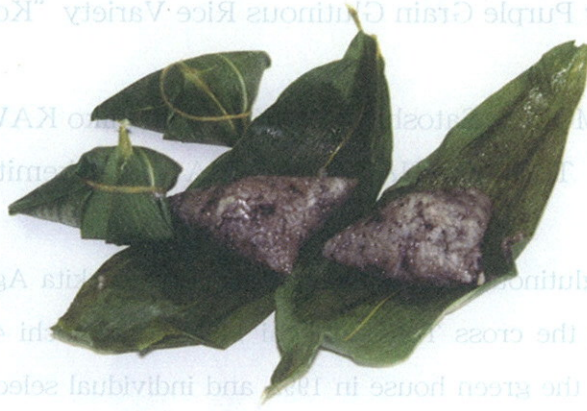
写真3 小紫で作った笹巻