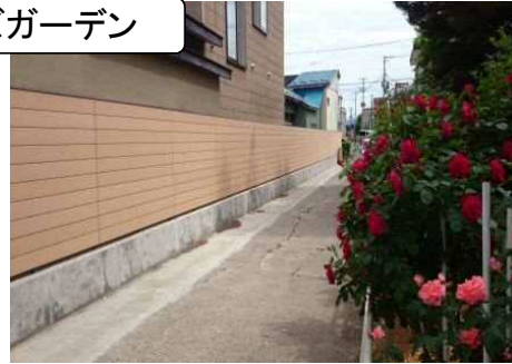
門扉・柵(再生有機系建材)