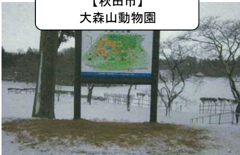
案内看板(加圧処理木材)