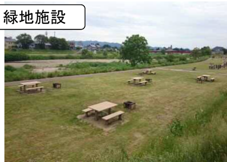
ベンチ・テーブル(再生有機系建材)