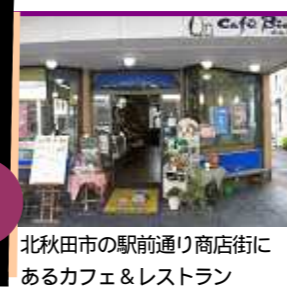
北秋田市の駅前通り商店街にあるカフェ&レストラン

お子さん連れに優しいお店 カフェ・ピオ 「小さい子どもと一緒にカフェって入りにくいわ」という声が聞かれます...でも、カフェ・ピオさんは、そんなことはありません。 店内は、一階と二階スペースがあり、すべてのフロアがバリアフリー。二階へはエレベーターがあるので、ベビーカーのまま移動できるんです。 二階のフロアは、ゆったりとした空間で、中央にはグループでも利用できる大きなテーブルがあります。テーブル前にはテレビがあり、お店の方に声を掛けると子供向けのDVDを流してくれるそうです。子供用イスもあるので安心です。 また、1階には、おむつ替えベッドや子供用の便座がある多機能トイレが併設。さらに女性用トイレには幼児用のイスが設置されているので小さな子供が一緒でも安心。 ほかに子供向けのキッズメニューがあるので、お母さんも好きなメニューを注文できると思います。キッズ用のパスタは短い麺を使っているそうですよ。 店長さんによると、ご自身の子育ての経験からも「誰にでも優しいお店があればいいな」という思いが詰まっているお店だそうです。