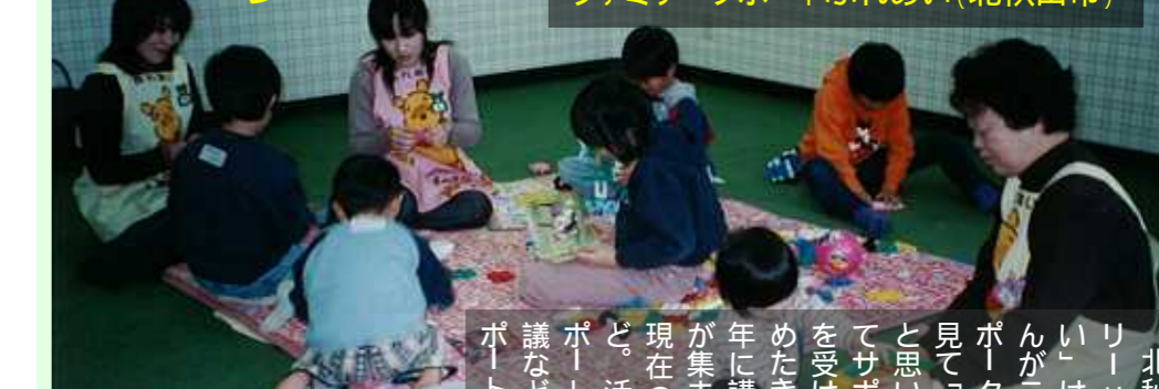
ファミリーサポートふれあい(北秋田市)

P3 子育てイベント告知 大館・北秋田地区の子育て情報 読み聞かせ会のお知らせ 今月のイクメン 育児先を楽しんでいるお父さんの紹介！