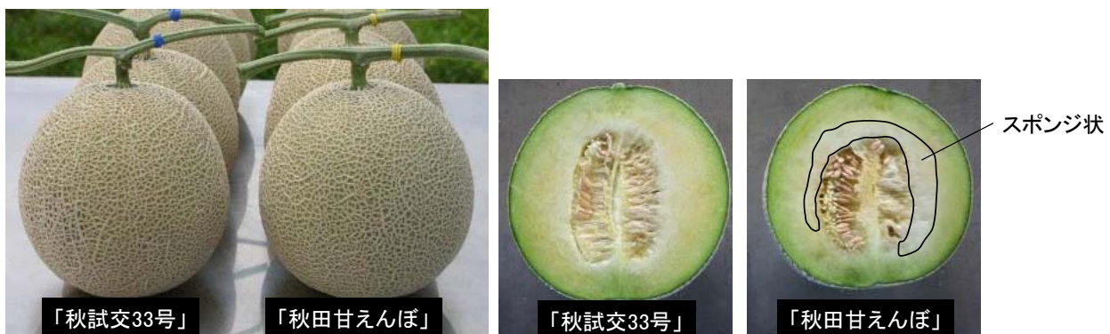
図2. 果実の比較（2013年、現地汚染圃場）

注2) 耕種概要：ハウス抑制栽培、試験場所：農試ビニールハウス、5株/系統、畝幅1.2m、株間30cm、立体1本仕立て1果どり、播種7月上旬、定植7月下旬、収穫10月中旬、施肥量(kg/a N:P 2 O 5 :K 2 O)=1.6:1.7:0.9。