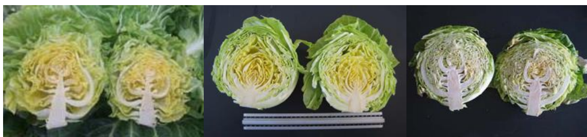
図1 収穫物の断面写真(10/6定植の「春波」) 左より、3/8収穫(内部抽だい)、4/2収穫、5/7収穫。

耕種概要は表1に順ずる。個体率:定植数当たりの比率。収穫日:内部抽だい個体を含む。月別収穫率:内部抽だい個体を除く、定植数当たりの比率。下線の数値は別に内部抽だい個体があることを示す。球重:収穫調整球重の平均値。球密度:[球重]/[推定体積]の平均値。推定体積:調整球を楕円球と仮定し、径及び高さの測定値から算出した。収量:内部抽だいを除く収穫率及び平均球重から概算した。調査