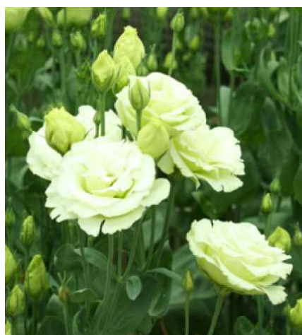
B「こまちグリーンドレス」