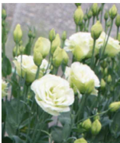
A「こまちホワイトドレス」