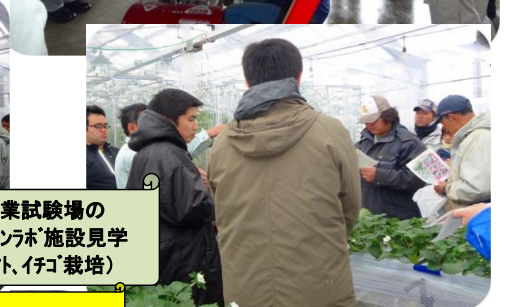
農業試験場の オープンラボ施設見学 (トマト、イチゴ栽培)