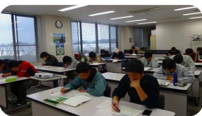
「日本農業技術検定」試験に向けた座学 (試験日：H26.12、13秋田テルサ)