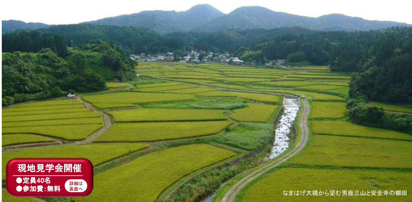
なまはげ大橋から望む男鹿三山と安全寺の棚田