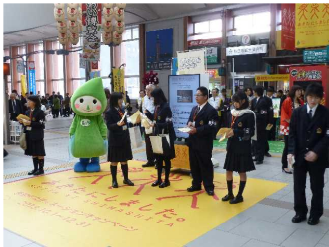
森っちと国学館高校の生徒の皆さん