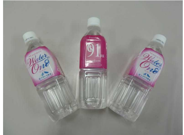
タプロス株式会社様からミネラルウォーター48本を御提供いただきました。