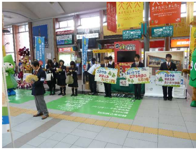
J R 秋田駅中央改札口前にて駅前あいさつ運動を行いました。