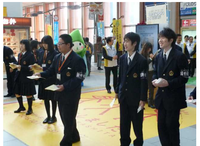
13名の生徒さんが、昨年に引き続きあいさつ運動に参加してくださいました。