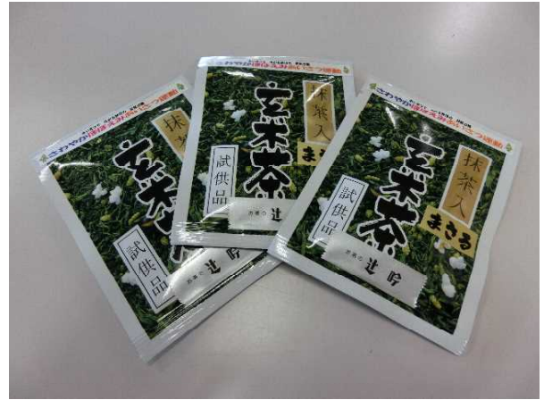
株式会社辻吟様より辻吟のお茶100袋を御提供いただきました。