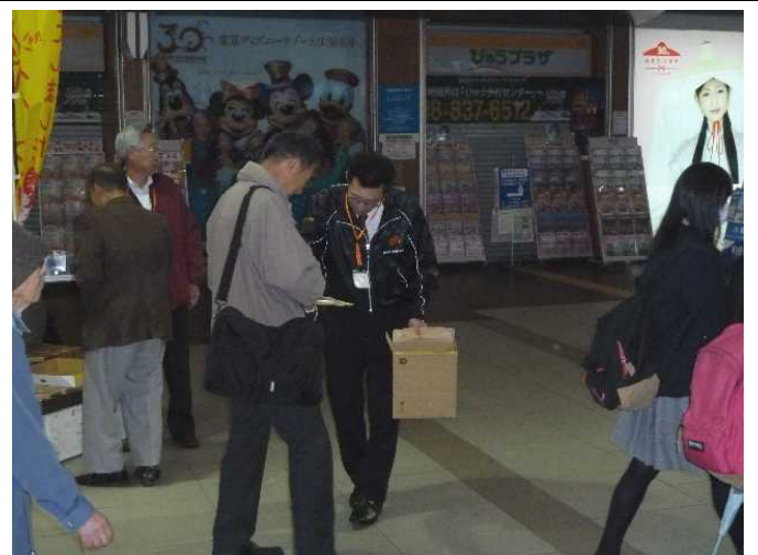
ダイドードリンコの方々も2年連続で御協力いただきました。缶コーヒーを御提供いただき、皆さん大変喜んでいました。