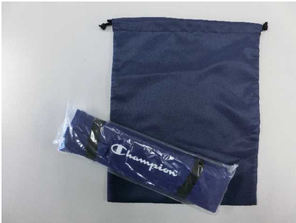
ゼビオスポーツ株式会社様よりスポーツ用品16点を御提供いただきました。