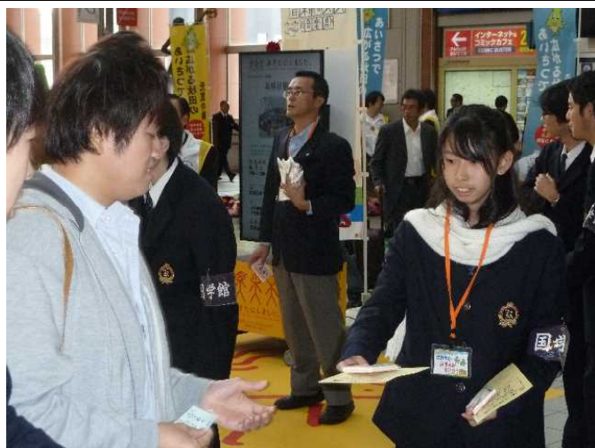
元気なあいさつと明るい笑顔で、通勤・通学の皆さんに声をかけてくださいました。