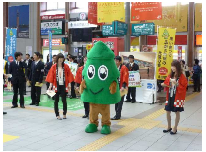
スギッチと農林中央金庫の皆さん。元気いっぱいの声を響かせてくださいました。