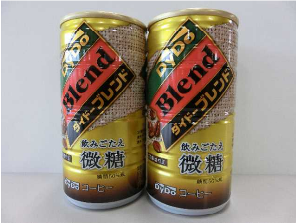
ダイドードリンコ株式会社様から缶コーヒー300本を御提供いただきました。

今回のあいさつ運動の実施にあたり、県内企業の皆様に、たくさんの品物を御提供いただきました。本当にありがとうございました。