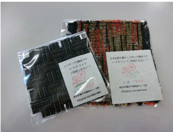
NPO法人工房こすもす様よりコースター110枚を御提供いただきました。