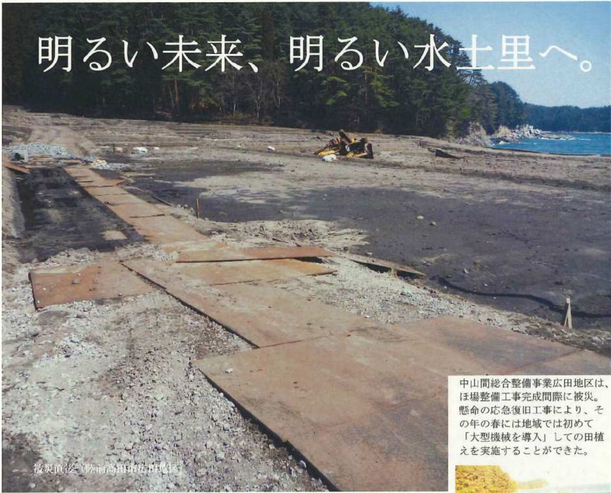
被災直後（陸前高田市広田地区）

中山間総合整備事業広田地区は、ほ場整備工事完成間際に被災。懸命の応急復旧工事により、その年の春には地域では初めて「大型機械を導入」しての田植えを実施することができた。