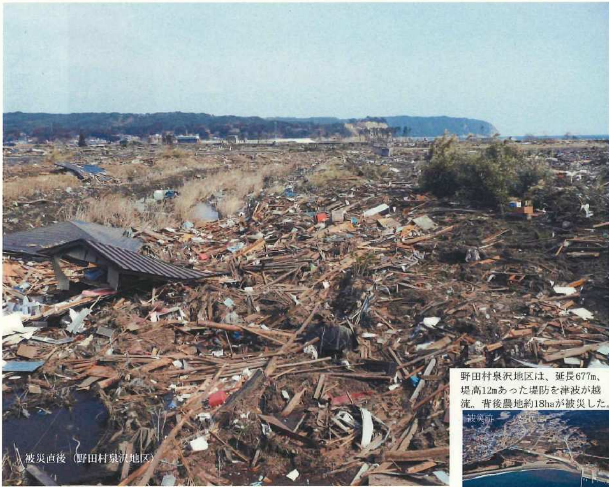
被災直後（野田村泉沢地区）

野田村泉沢地区は、延長677m、堤高12mあった堤防を津波が越流。背後農地約18haが被災した。