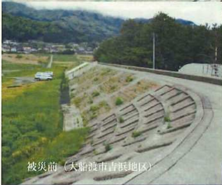
被災前（大船渡市吉浜地区）

大船渡市吉浜地区は、延長570mあった堤防が津波により全壊。背後農地約28haが被災した。