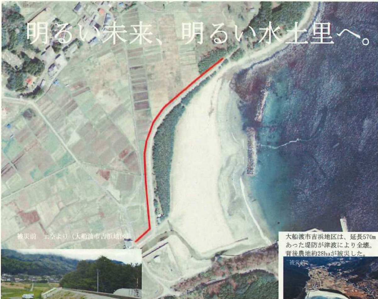
被災前 上空より（大船渡市吉浜地区）

大船渡市吉浜地区は、延長570mあった堤防が津波により全壊。背後農地約28haが被災した。