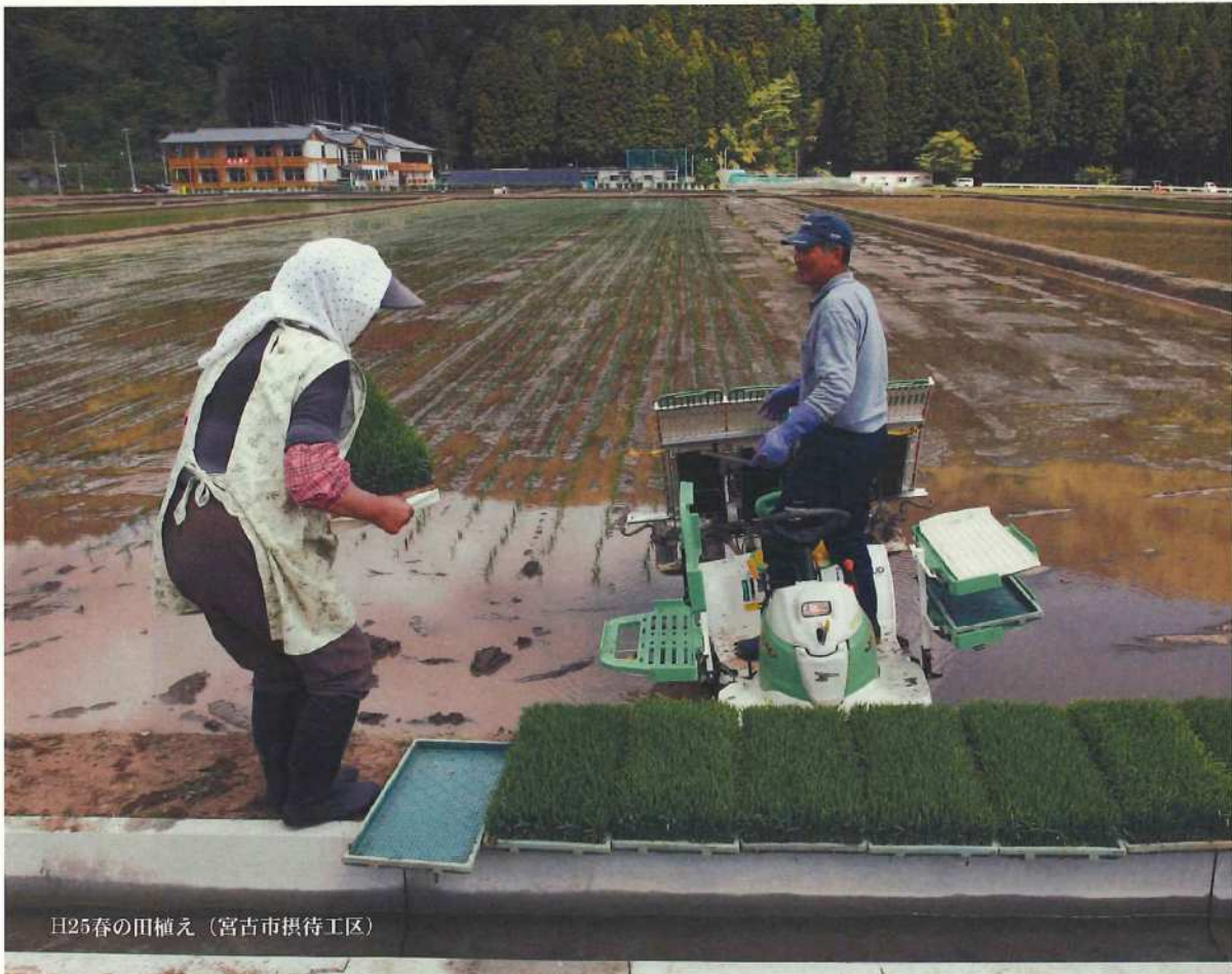
H25春の田植え (宮古市摂待工区)