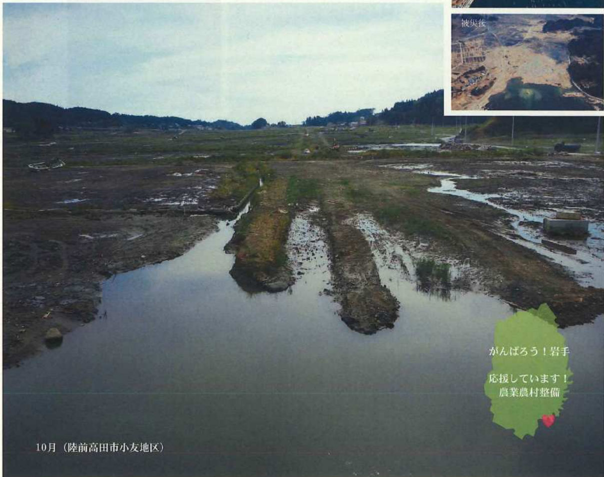
10月（陸前高田市小友地区）