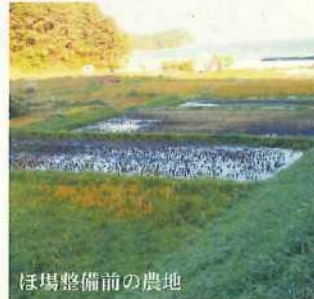
ほ場整備前の農地

中山間総合整備事業広田地区は、ほ場整備工事完成間際に被災。懸命の応急復旧工事により、その年の春には地域では初めて「大型機械を導入」しての田植えを実施することができた。