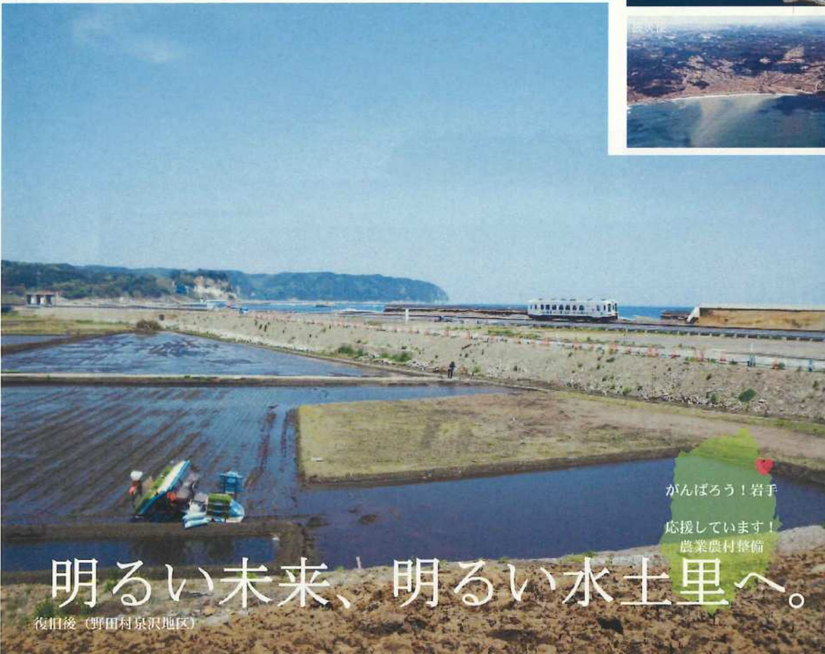
復旧後（野田村泉沢地区）