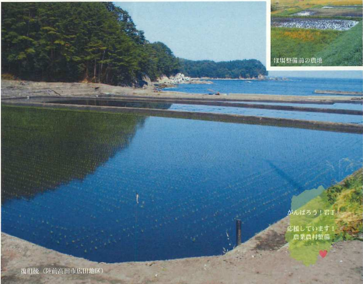
復旧後（陸前高田市広田地区）