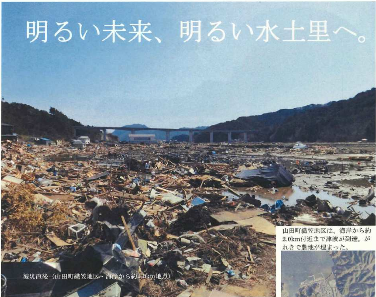
被災直後（山田町織笠地区・海岸から約2.0km地点）

山田町織笠地区は、海岸から約2.0km付近まで津波が到達。がれきで農地が埋まった。