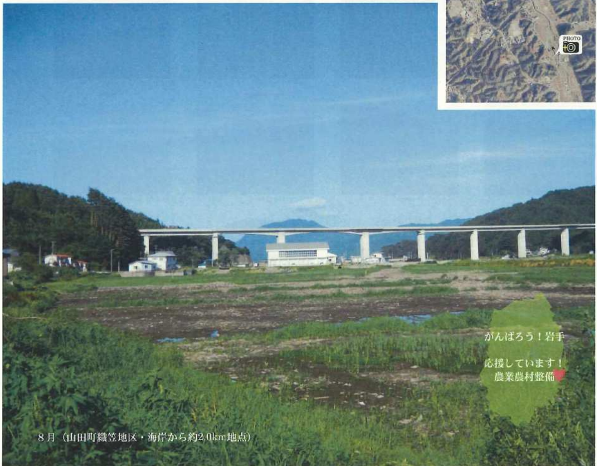
8月（山田町織笠地区・海岸から約2.0km地点）