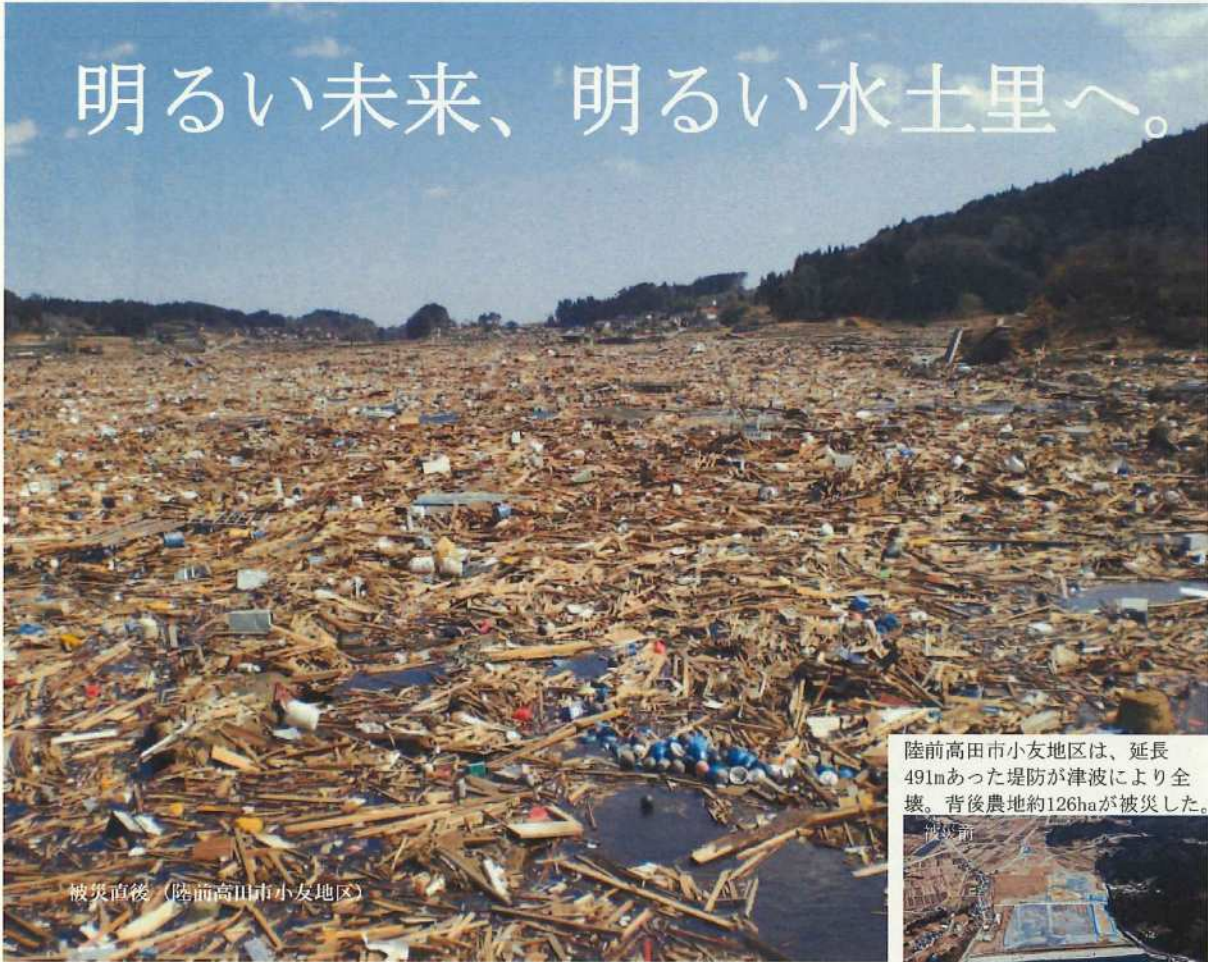
被災直後（陸前高田市小友地区）

陸前高田市小友地区は、延長491mあった堤防が津波により全壊。背後農地約126haが被災した。