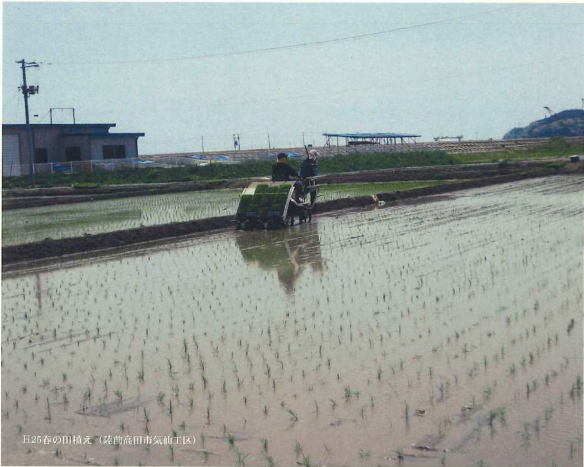
日25春の田植え（陸前高田市気仙工区）