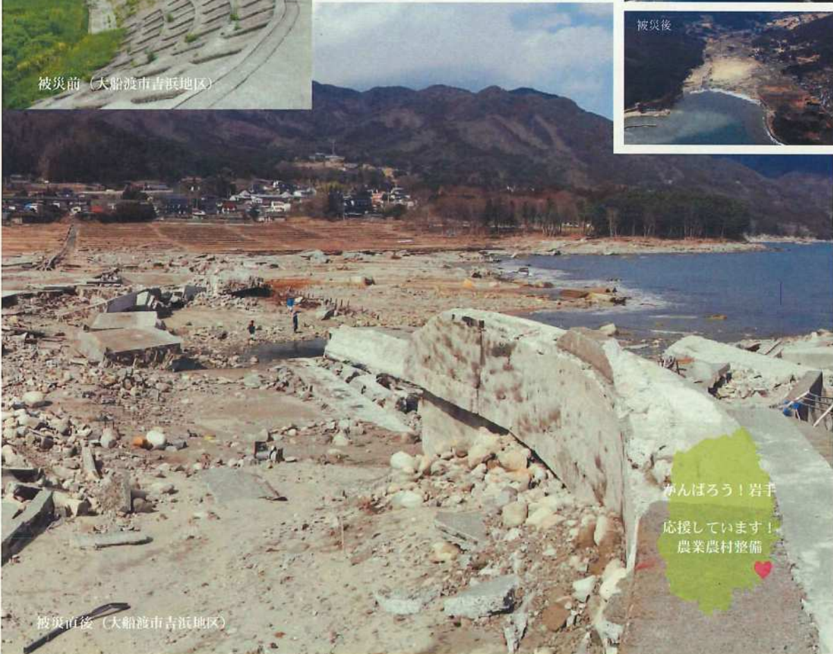
被災直後（大船渡市吉浜地区）