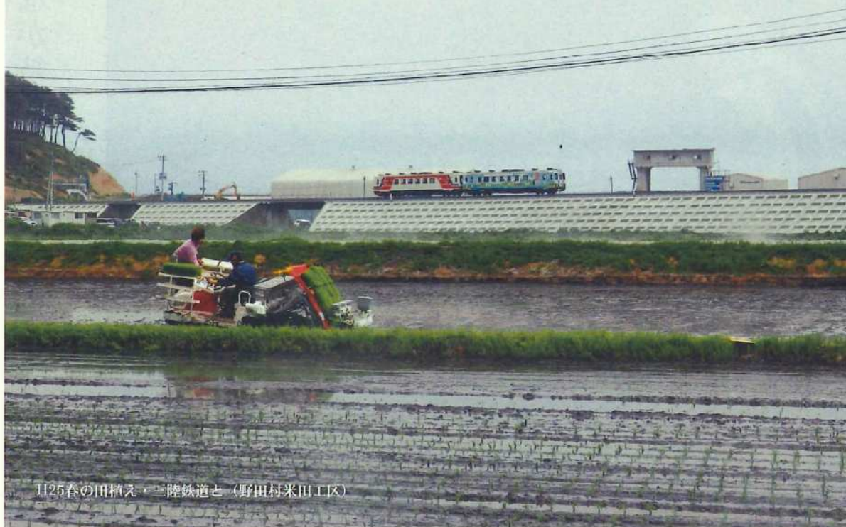
H25春の田植え・三陸鉄道と（野田村米田工区）

写真奥に見える三陸鉄道、通称『三鉄（さんてつ）』は、岩手県の三陸海岸を縦貫する路線を持つ、第三セクター方式の鉄道会社です。平成25年度前期NHK連続テレビ小説『あまちゃん』に、この北リアス線が『北三陸鉄道リアス線』（通称『北鉄』）として登場しています。