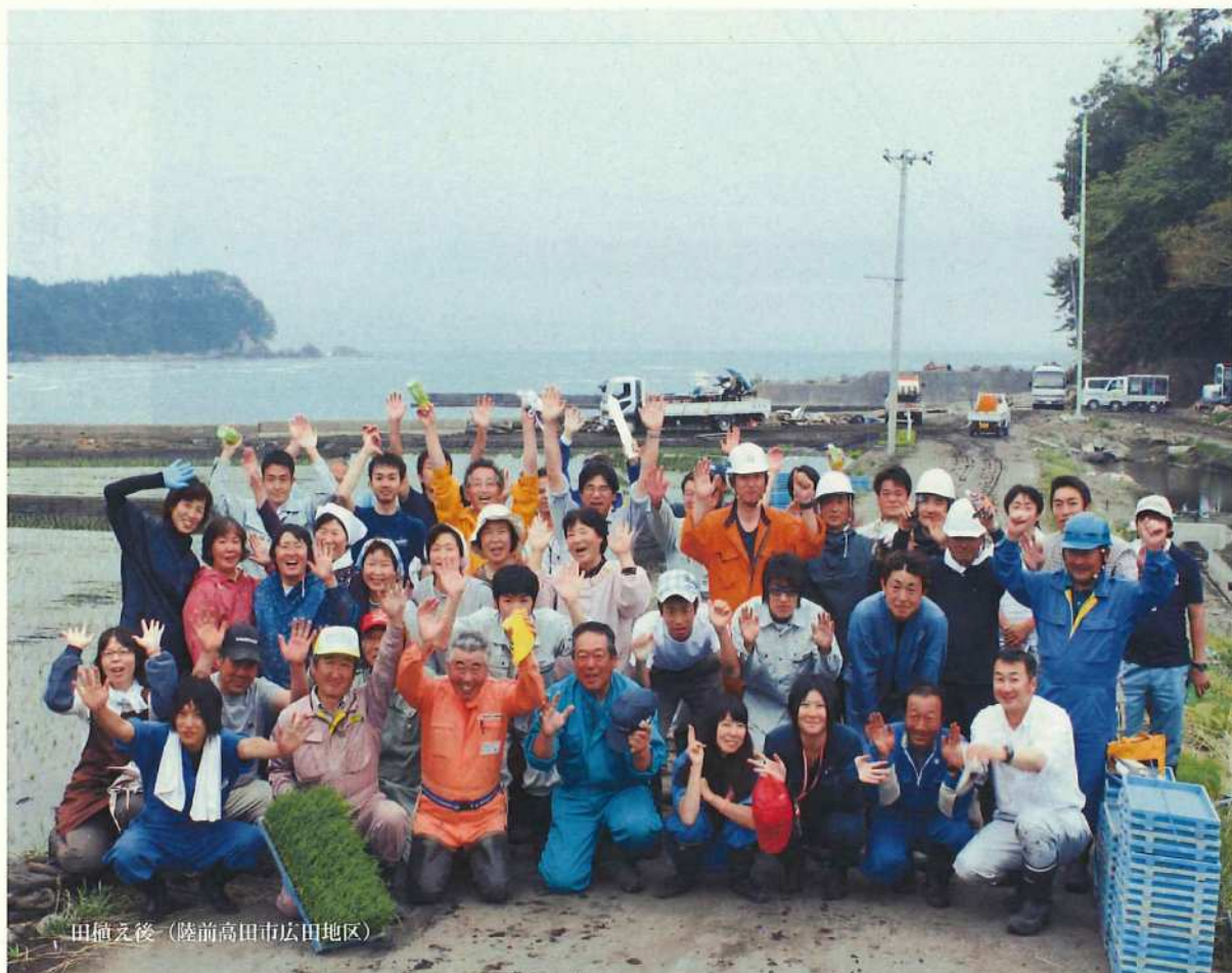
田植え後（陸前高田市広田地区）