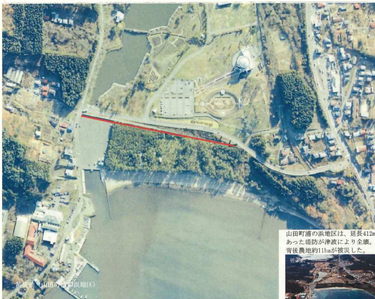
山田町浦の浜地区は、延長412m あった堤防が津波により全壊。 背後農地約11haが被災した。