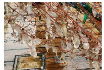
図 底びき網の目に絡んだサルパ（道川沖水深265m）

本県沿岸で刺網等にゼリー状のものが大量に絡みつき、外すのに大変な手間がかかる被害が発生しています。これらはゼリー状の体の中にオレンジ色の球（内臓）が目立つのが特徴の「サルパ」と呼ばれるホヤの仲間で、クラゲではありません。サルパ類の生活形態には、複数の個体が鎖状につながった群体と単独個体とがあり、今回は海中を大量に漂う群体が網に絡みついているようです。本年7月30日に調査船千秋丸で行った底びき網調査でも袋網が目詰まりするほど入網しました。今後も秋にかけて漁業被害が予想されますので、ご注意ください。