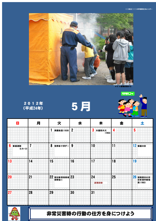
県内小学校が作成したカレンダー