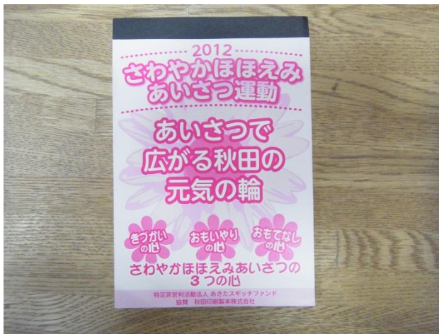
秋田印刷製本株式会社様はメモ帳を作製して提供してくださいました。