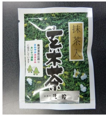
株式会社社吟様からはお茶を300袋提供していただきました。

あいさつと一緒に渡したのは、お茶、コースター、ボールペン、チャック付ビニール袋、メモ帳等、あいさつ運動に御賛同いただいた県内の様々な企業や団体から、無償で提供していただいたものです。多くの方々の協力のもと、今回の取組を行うことができました。