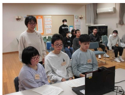
【交流に参加する生徒】

生徒からは「他校の寄宿舎の友達ができてうれしい」「懐かしい先生に会えて良かった」など、他校とのつながりを実感する感想がたくさん聞かれています。今後も内容を工夫しながら、寄宿舎生活の充実と学校間のつながりのより一層の広がりを目指して実施していきたいと考えています。