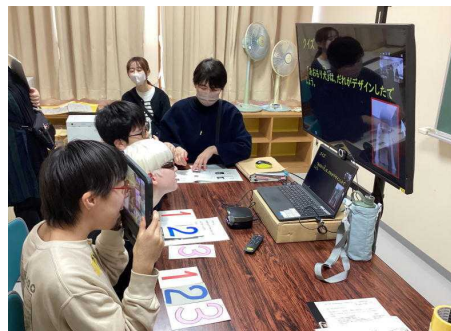
【青森県民クイズは難問だけど面白い！】

コロナ禍で進んだオンライン交流ですが、少人数化の波をとらえながら、児童同士の学習の一つの機会として、今後も交流授業の在り方を模索していきたいと考えています。