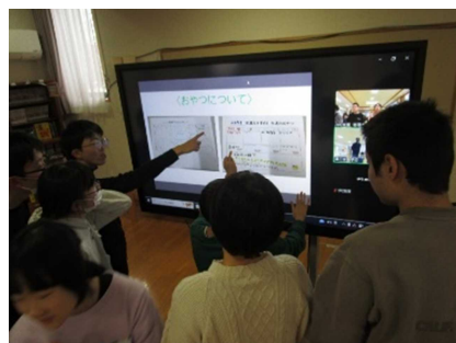
【他校の寄宿舎に興味津々】