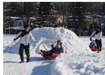
おやじの会：雪遊びを高校生ボランティアも一緒に行いました。