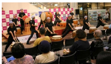
高等部3年生 「曲耀太鼓」