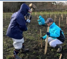
能代支援学校生徒による支柱立て

「知事賞」 県立ゆり支援学校 「東北森林管理局長賞」 県立比内支援学校たかのす校 「県教育委員会教育長賞」 県立大曲支援学校 「県森林組合連合会会長賞」 県立比内支援学校かづの校 「秋田県森と水の協会会長賞」 県立比内支援学校