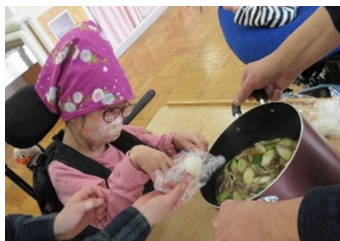
初めて口にするセリの味。「だまこ鍋」が完成しました。