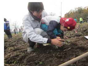
能代支援学校児童生徒による植樹