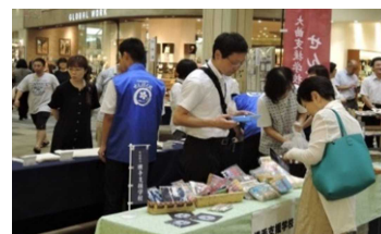
作業学習製品 販売