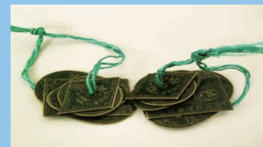
園内通用券(院内通貨) 入所者の逃亡防止のため、お金の代わりにその療養所だけで通用する通貨を発行していました。