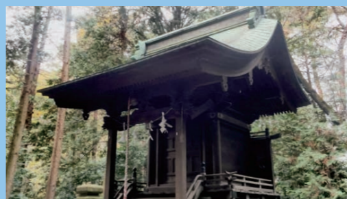
多磨全生園内にある永代(ながよ)神社 療養所の中で生涯を終えることを覚悟しなくてはならなかった時代、入所者が技術を持ち寄って建設したそうです。

秋田県では、療養所で暮らしている本県出身の方々を訪問し、日々の状況をお伺いしたり、現在の秋田の情報をお伝えする「訪問事業」などを実施し、遠く離れたふるさとを少しでも身近に感じていただく取組を行っています。