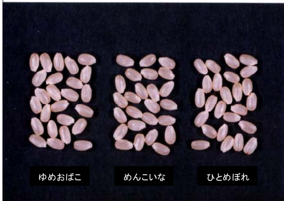
図1 「ゆめおぼこ」の玄米