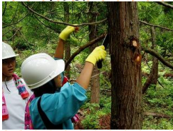
学校林の枝打ち(湯沢市) (単位:千円、校、人)