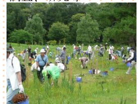
下刈り作業 (単位:千円、人)