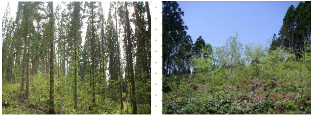
点状誘導伐:強度に伐採 (北秋田市)

生育の思わしくないスギ人工林を強度伐採し、針葉樹と広葉樹が混じり合った彩り豊かな混交林へ誘導