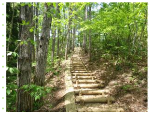
森林環境教育の森 (横手市)