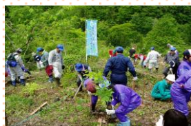
雄勝漁協ブナ植樹(湯沢市) (単位:千円、団体、人)