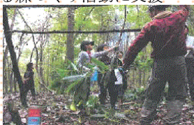
森のワークショップ(仙北市)