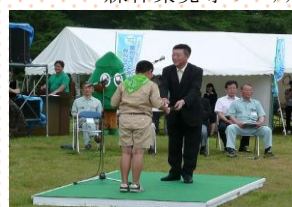
秋田県森林祭(北秋田市)