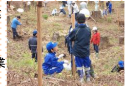
植樹祭(上小阿仁村) (単位:千円、件、人)