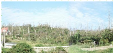
枯れ松の伐採処理前 (秋田市)

松くい虫被害により枯死・白骨化した枯れ松を伐採処理し、マツ林の景観向上及び健全化