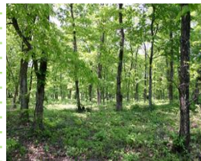
里山の森林公園 (能代市)

森林環境の保全、森林環境教育、森林ボランティア活動の場等として利用できる、里山の活用モデルとなる森林公園を整備