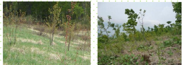
切留平牧場跡地 (鹿角市)

過去に損なわれた森林環境を取り戻し、野生動物植物などが生息・生育できる豊かな生態系を有した広葉樹林へ再生