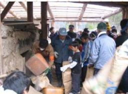
松くい被害材の炭焼き(秋田市) (単位:千円、団体、人)

イ)安全作業リーダー育成事業 森林ボランティアを対象とした安 全作業研修会の開催