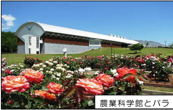
農業科学館とバラ