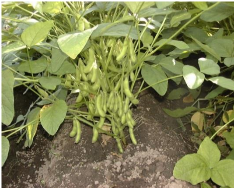
県産エダマメ収穫期(8月下旬～)