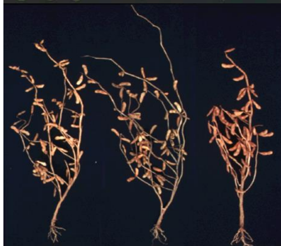
あきたみどり 青目大豆 秋試緑1号