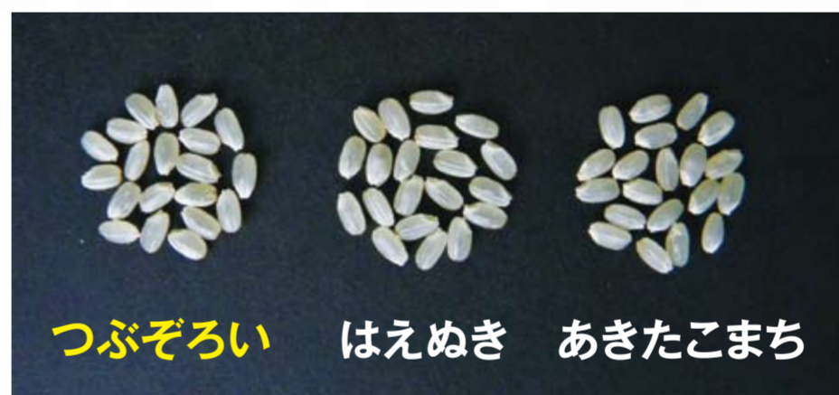
つぶぞろい はえぬき あきたこまち