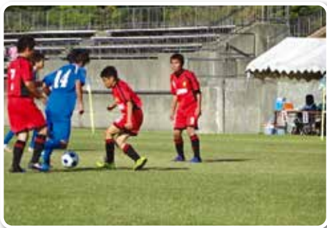
特別支援学校総合体育大会：サッカー競技