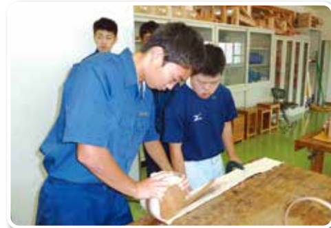
高等部：高等学校との共同制作による 曲げわっぱづくり