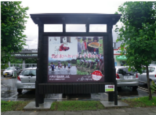
加圧処理木材 (田沢)