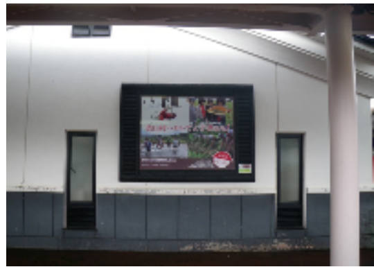
加圧処理木材 (角館)