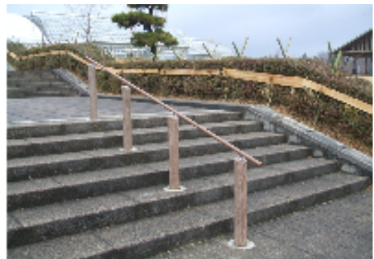
再生有機系建材・加圧処理木材