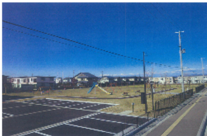
溶融スラグ入りコンクリート製品・木質系舗装材