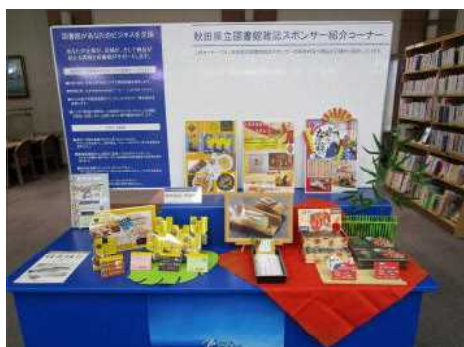
◀ 雑誌スポンサー紹介コーナー