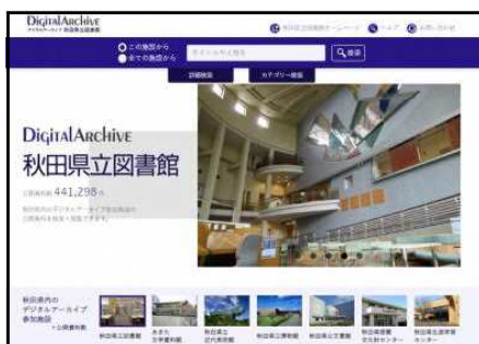
◀ 秋田県立図書館デジタルアーカイブ