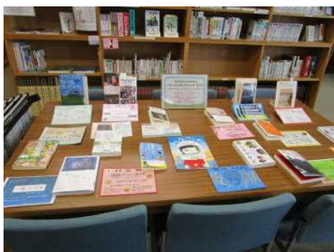
▲学校図書館の取組の様子