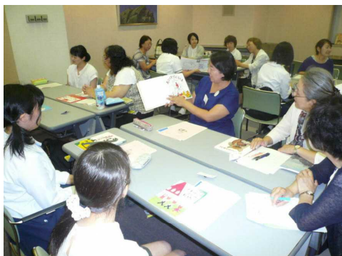
▲読み聞かせボランティア養成講座