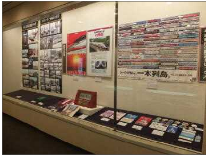
◀ 県立博物館と連携した特別展示