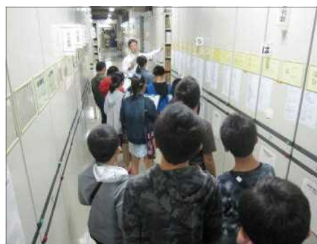
▲セカンドスクールにおける 施設見学の様子