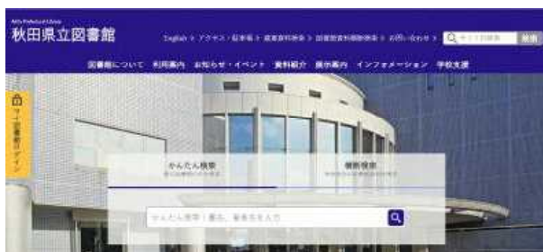
▲秋田県立図書館ウェブサイト