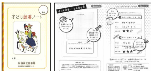
▲子ども読書ノート