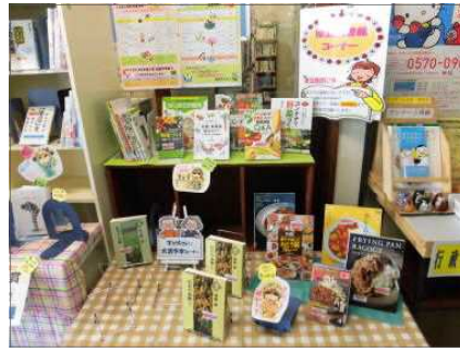
◀ ▲市町村立図書館向けセット資料の貸出