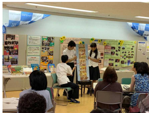
▲読み聞かせボランティア交流会