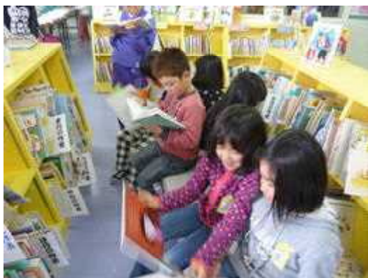
◀ 休み時間に学校図書館で 友達と絵本を読む子どもたち