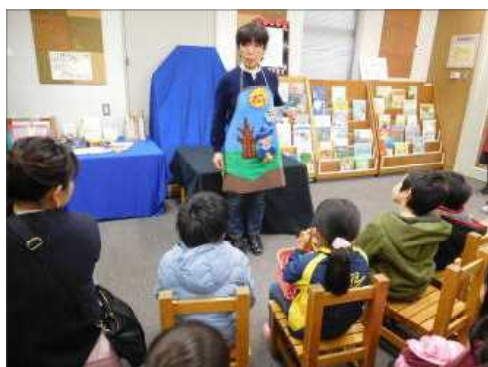
▲夏のおはなし会の様子