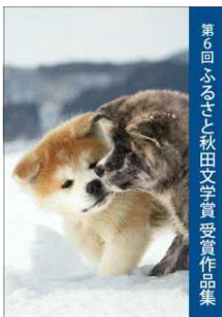
◀ 第6回ふるさと秋田文学賞受賞作品集