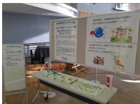
▲東北農政局と連携した展示