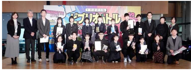
▲ビブリアバトル県大会の様子