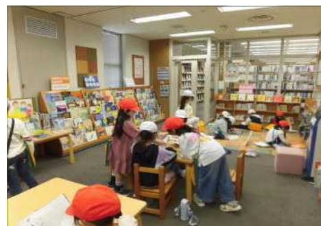
▲セカンドスクールの利用における 読書体験の様子