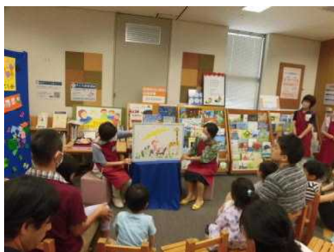
▲おはなしタイムの様子