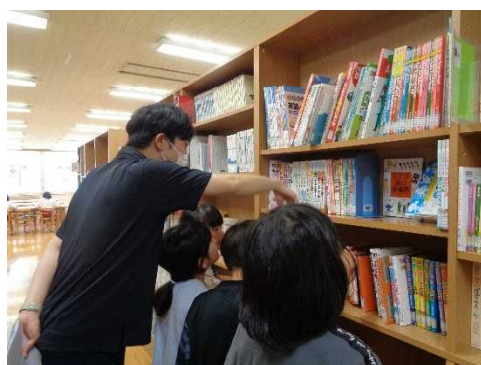
◀ 学級担任や教科担任による 選書アドバイス