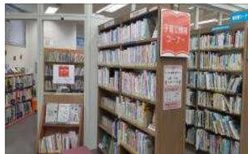
▲子育て情報コーナー