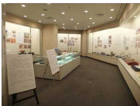
▲埋蔵文化財センターと連携した特別展示