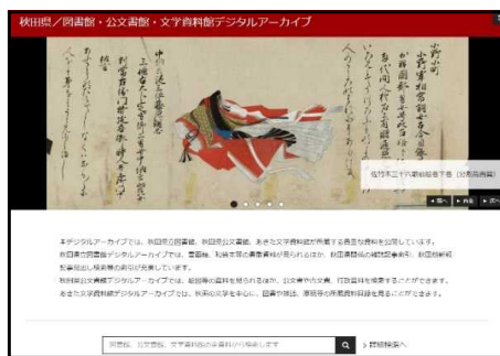
◀秋田県／図書館・公文書館・文学資料館デジタルアーカイブ