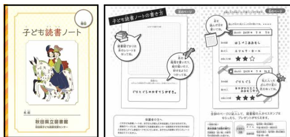
▲子ども読書ノート