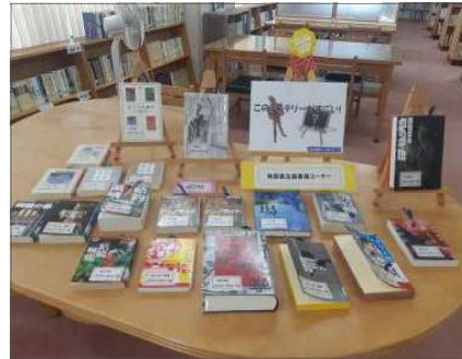
▲市町村立図書館向けセット資料の貸出