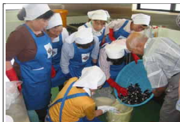
なすの加工場漬物作り