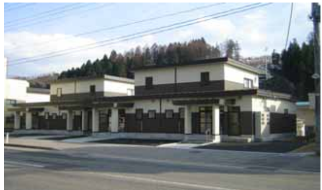
コミュニティ住宅