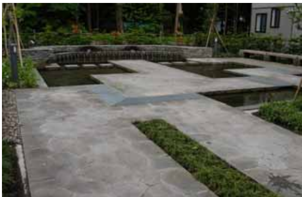
ポケットパーク整備