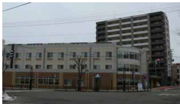
横手駅東口第一地区