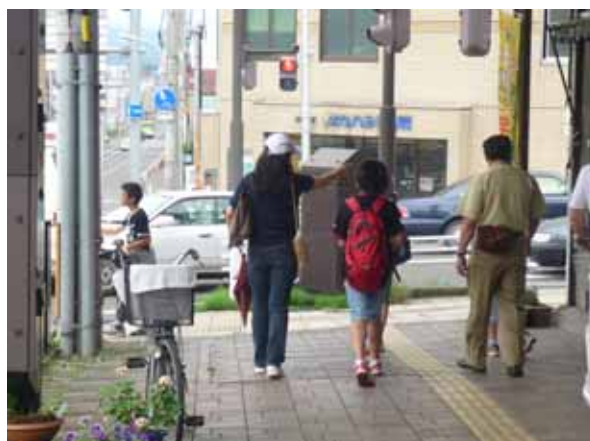
オオダテまちなみ学習 (平成21年度開催風景)