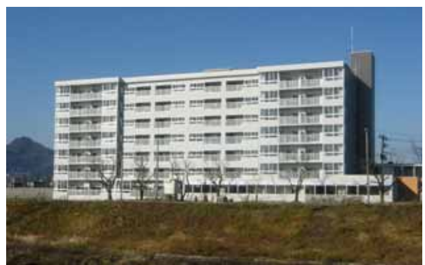
都市再生住宅(丸子川側)