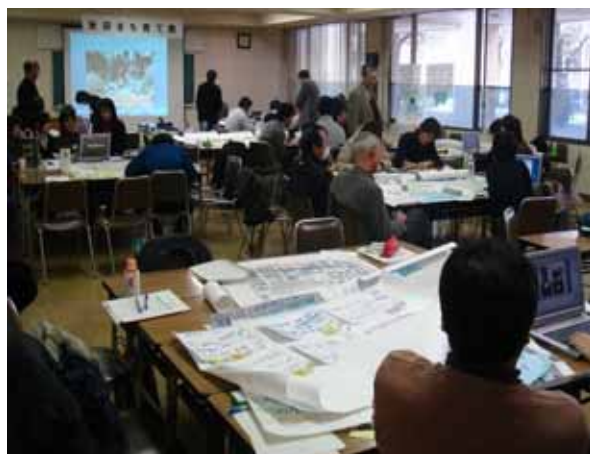
まち育て塾 (平成20年度開催風景)

「秋田まち育て塾」に引き続き、平成21年度には、これからの「まち育て」活動の普及を目指し、これからのまちづくりの活動の主役となる地元小学生に「まち」を歩いて体験してもらう「オオダテまちなみ学習」を実施する等、地域でのまちづくりに主体的に取り組むことのできる人材の育成を図ります。