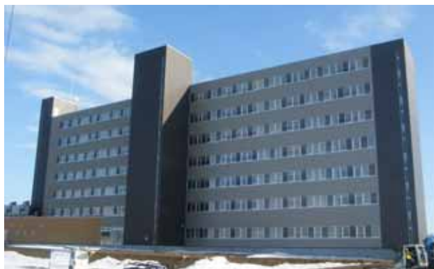
都市再生住宅(正面)