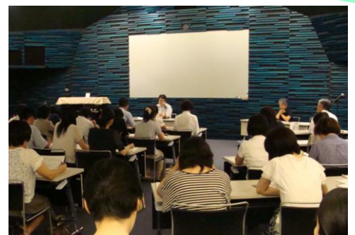
なんと会場はカダーレのプラネタリウムの中でした