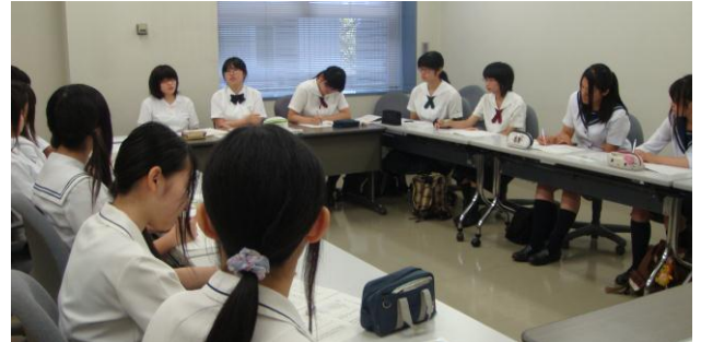
他校の実践アイデアに耳を傾ける情報交換会