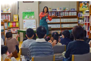
湯沢図書館での読み聞かせ

湯沢図書館の呼びかけにより、平成13年の結成以来、毎月第4土曜日に行っている定例の「おはなし会」は通算で132回になりました。7月には楽しみ会、12月にはクリスマス会も開催しています。こうして、たくさんのお子様や保護者たちに、絵本と接する機会をつくり、おはなし好き、絵本好きのお子様たちを育ててきました。