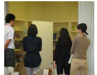
事前に協議する司書たち

この研修会の講師を務めたのは、県立図書館の4人の「打って出る司書」です。彼らは、短時間で効果的な研修となるように、図書館の造りを調べ、昼休みの子どもたちの利用の様子を観察し、改善のポイントを協議するなど、事前準備を入念に行っており、これまでの経験から得られた、図書館の効果的な実践例を紹介し、参加者の今後の活動につながる情報提供をしました。