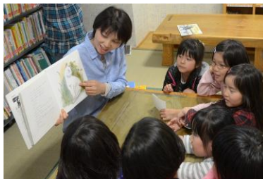
大曲図書館での読み聞かせ

返却時に書いてもらった「私のおすすめ本」と題したミニミニ感想文を毎月掲示することで、子どもたちの読書への関心が高まってきました。