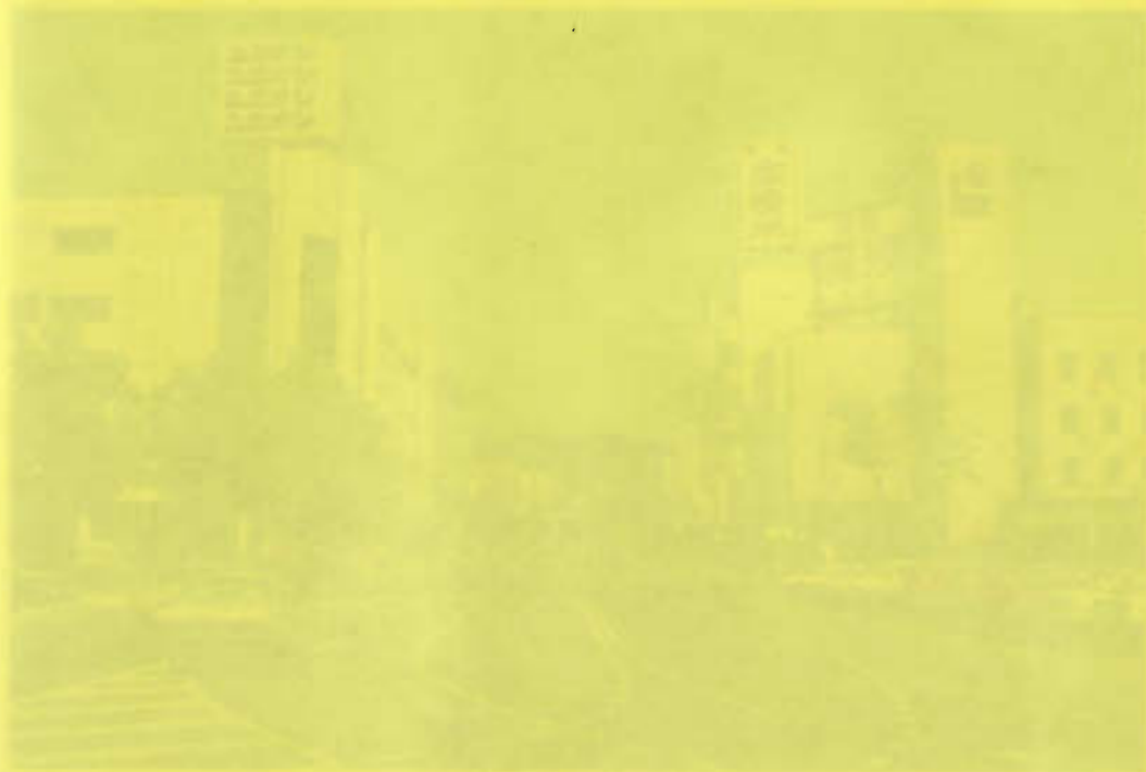
東京市街地計画図