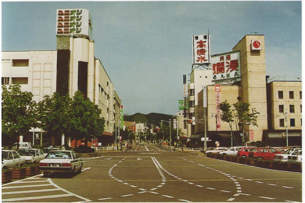
横浜市駅前地区土地区画整理事業