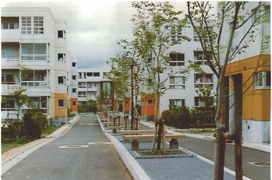
県営新屋団地ブルーパール