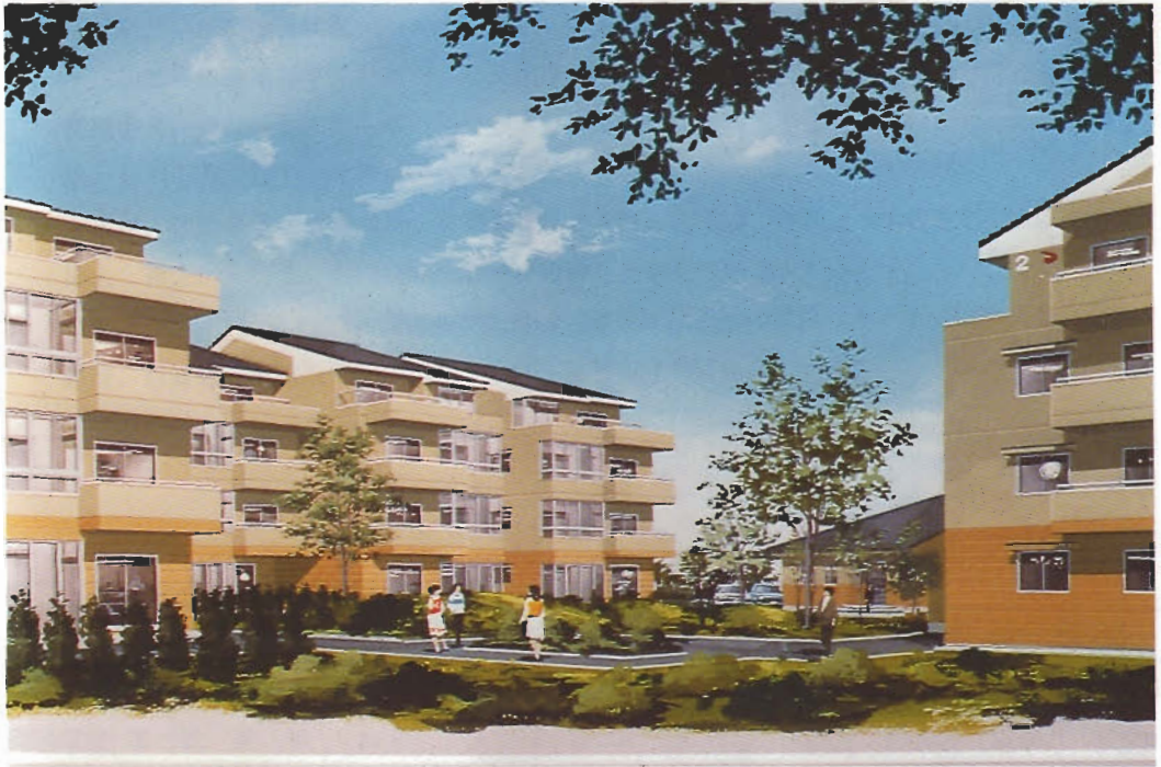
県営土崎団地（仮称）完成予想図