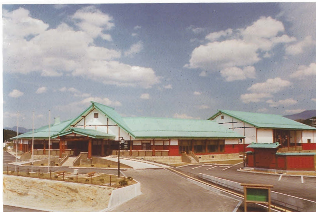
角館広域交流センター（角館町）