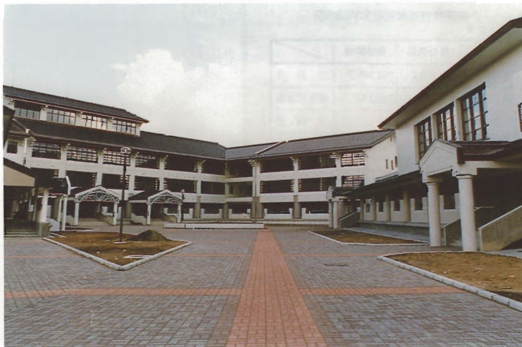
本荘高等学校（本荘市）