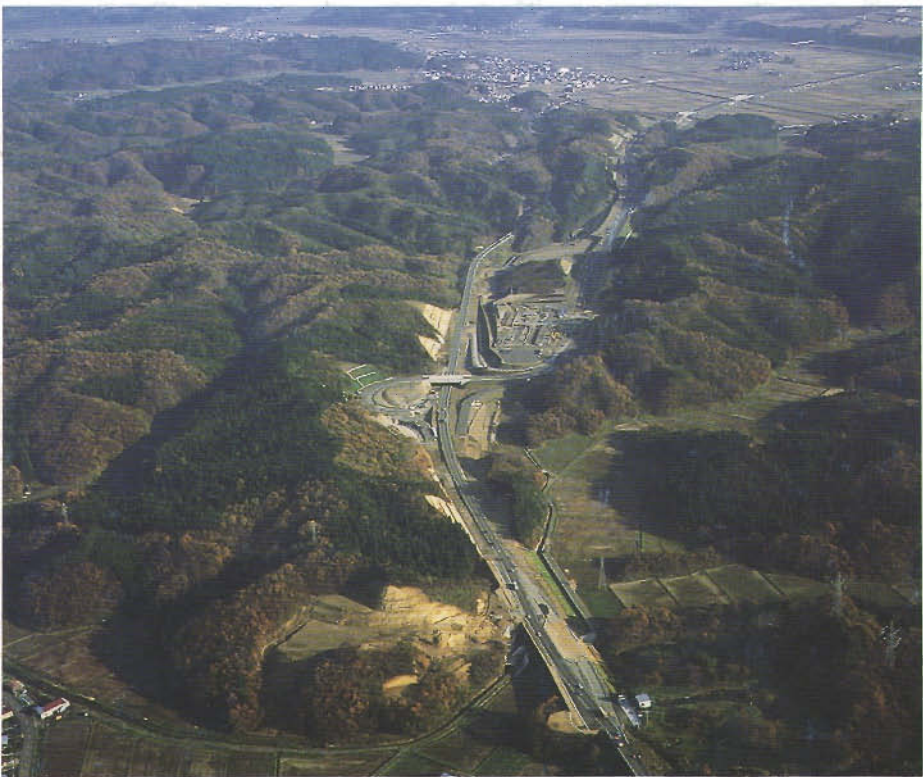
(秋田自動車道秋田南インターチェンジ)